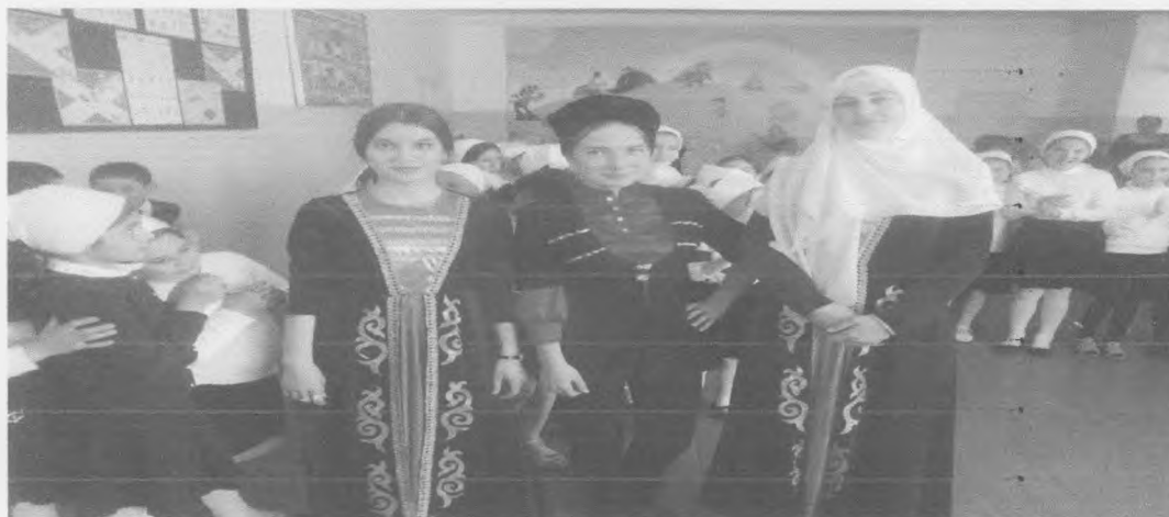
«Мои первые шаги в профессии»